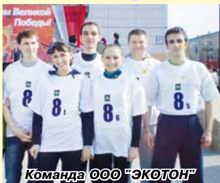
Команда ООО "ЭКОТОН"

9 мая 2012 года в г.Пыть-Яхе прошла командная легкоатлетическая эстафета в зачет XII Спартакиады среди производственных коллективов, организаций и учреждений го-