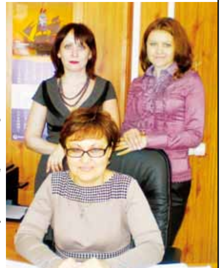
Сотрудники отдела кадров ООО "УТТ N 7"