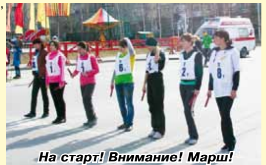
На старт! Внимание! Марш!

Руководство и коллектив компании ООО «ЭКОТОН» поздравляют спортсменов, желают им здоровья и дальнейших побед во всех спортивных соревнованиях.