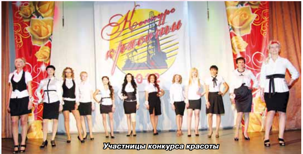
Участницы конкурса красоты

12 обаятельных и привлекательных вышли на сцену КДЦ «Факел», чтобы в равной борьбе определилась лучшая из лучших. Сражение сотрудниц ООО «ЭКОТОН» и ООО «УТТ N 7» было поистине женственным: мягким, нежным, интригующим, и не менее зрелищным, чем мужские