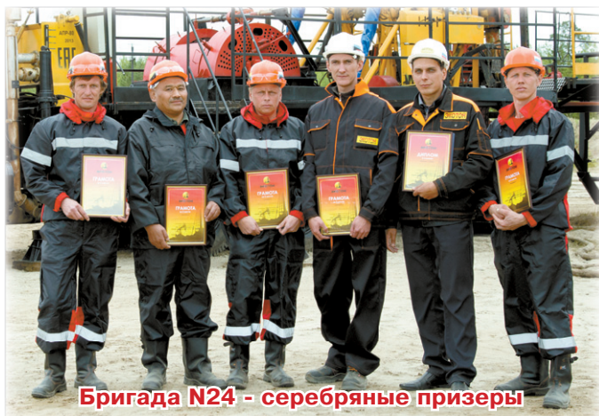
Бригада N24 - серебряные призеры