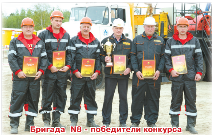
Бригада N8 - победители конкурса