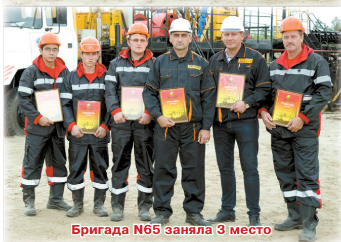
Бригада N65 заняла 3 место