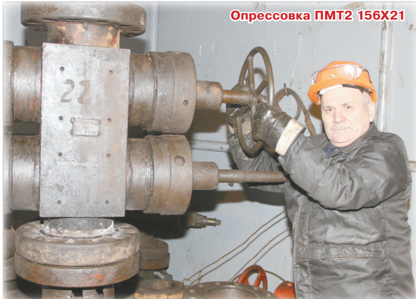
Опрессовка ПМТ2 156X21