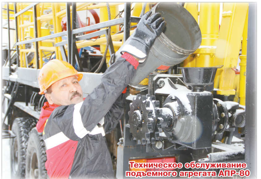
Техническое обслуживание подъемного агрегата АПР-80