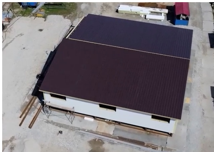
Столовая ПРЗ ЦКРС №1 на этапе строительства июнь 2023 г.

В августе 2023 года, накануне Дня работника нефтяной и газовой промышленности, приступила к работе новая столовая на базе ПРЗ в ЦКРС № 1. Это стало приятным событием для всех работников. Столовая оборудована современной раздаточной линией с поддержанием температурного режима. Новый обеденный зал рассчитан на 40 посадочных мест. Работники ООО «ЭКОТОН» и ООО «АЛЬЯНС» смогут питаться своевременно,