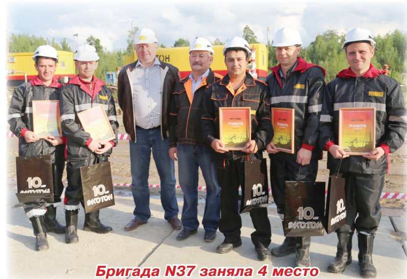
Бригада N37 заняла 4 место

С небольшим превышением штрафных баллов второе место заняла бригада №15 мастера Каримова Филюза Фанузовича. Серебряным призерам также